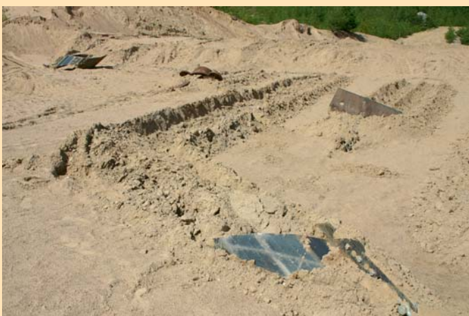
Sneddragning av Moorsafe ankare visar stabiliteten.