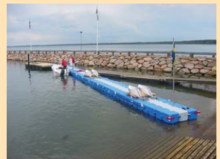
Moorsafe ankare lastade och klara för installation i Båstad.