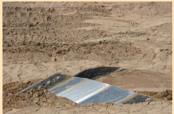
Moorsafe 330, efter ungefär en halv meters neddragning.