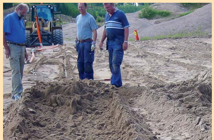
Spår från i sanden nerdraget Moorsafe 230.

Moorsafe ankaret är självstabiliserande i sin design. Ett test genomfördes då ett Moorsafe ankare drogs snett vilket visade hur ankaret smidigt följde dragriktningen utan tendens till kantring. Moorsafe ankare är lätta att hantera, landar alltid i rätt position då det sänks ned mot sjöbotten, penetrerar mycket snabbt ned i sjöbotten och uppnår mycket hög hållfasthet.