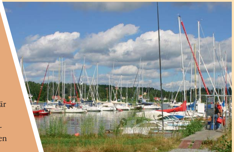
Småbåtshamn, TBK Åkersberga säkert förankrad med Moorsafe ankare.

Vi har valt att inte samarbeta med någon av de stora etablerade ankartillverkarna. Vi har därför börjat med mindre förankringsprojekt för att skaffa mer praktisk erfarenhet av att hantera och installera Moorsafe ankare. Vi har de senaste åren installerat över 150 Moorsafe ankare med mycket gott resultat som även överträffat våra högt ställda förväntningar.