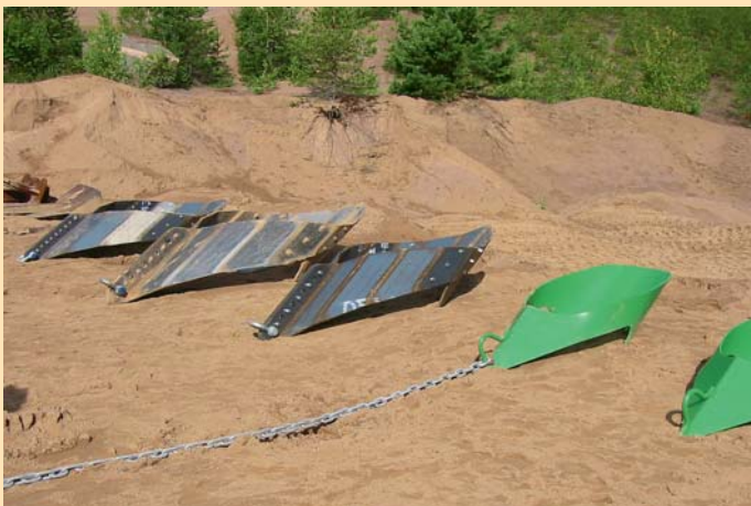
Moorsafe ankare redo för test.